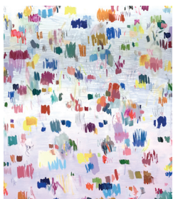
2 Nike de Beer „Isabelle“ 2017, Mischtechnik auf Leinwand, 185 x 210 cm 5900 €