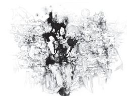
3 Sabine Banovic „Geheimnis“ 2017, Tusche + Pigmentmarker auf Leinwand, 170 x 230 cm 11.750 €