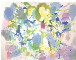
1 Winnie Seifert „Paradise Lost“ 2017, Öl auf Leinwand, 170 x 230 cm 6800 €

Die Ausstellung versteht sich als kritisch-humorvollen Link zu Mechanismen des Kapitalismus und Kunstmarkts. „Artflipping“, das Kaufen und (Wieder-)Verkaufen von vornehmlich großformatigen abstrakten Malereien vor allem junger Künstler_innen soll in einem diktierten Rahmen, dem einer Galerie, wiederholt und dem mittlerweile üblich gewordenen „flipping“, dem Onlinekauf, entgegengestellt werden. Das Verhältnis von Original und digitalem Abbild, von virtuellem und sinnlichem Raumerleben ist dabei ebenso Thema wie das Spiel mit der Präsentation der Malereien als Ware im „erhabenen“ Weiß der Kathedralen des Galeriewesens – dem White Cube.